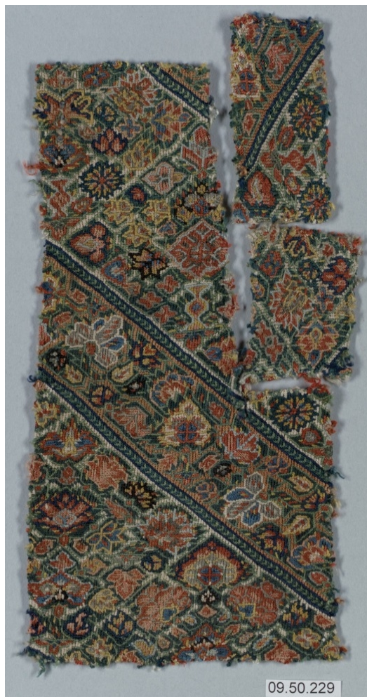
تصویر ۳. قطعه‌ای از پارچه شلوار زنانه مملو از نقوش گیاهی، عصر زندیه، محفوظ در موزه متروپولیتن.

نقاشی‌های برجای مانده از نیمه دوم قرن دوازدهم هجری بر رواج و رونق نقش گل در هنر زندیه گواهی می‌دهند. تصویر ۴ نمایانگر نگاره‌ای از کریم‌خان و درباریان است که پارچه بوتهدار لباس وکیل‌الرعیایا و چند تن از اطرافیان مشخص است.