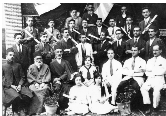
دانش‌آموزان، معلمان و مدیران مدرسه، همدان، ۱۹۲۷م.