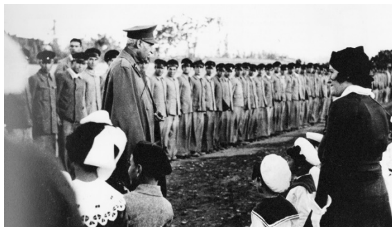
رضا شاه و دیدار دانش‌آموزان و معلمان مدرسه آلیانس همدان، ۱۹۳۶م.