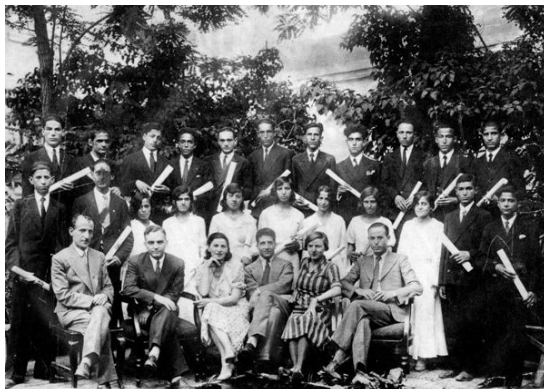
یکی از مدارس کلیمیان بعد از کشف حجاب، محل نگهداری: مرکز اسناد همدان، شماره‌ی بازیابی: