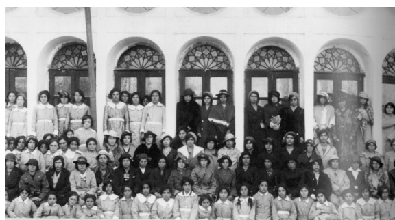
جشن مدرسه‌ی دختران، اصفهان، ۱۹۳۶م.