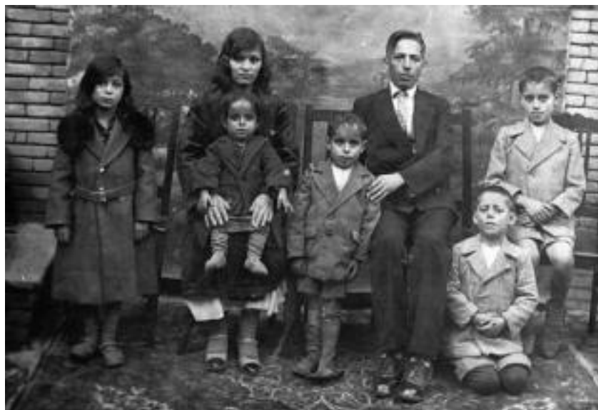
خانواده راسک، همدان، ۱۹۲۷

تأثیر اقدامات رضاشاه در وضعیت اجتماعی، اقتصادی و فرهنگی کلیمیان | ۱۳۱