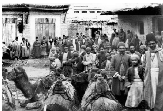
محلّه‌ی قدیمی کلیمیان تهران در سال‌های آغازین پهلوی اول