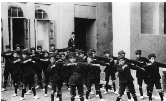
دانش آموزان یهودی با لباس فرم و کلاه پهلوی، یزد، ۱۹۳۱ م.