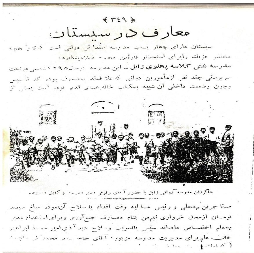
(پیوست شماره ۲) تصویر مدرسه احمدیه (پهلوی) سیستان در گزارش آقای تمدن، بازرس ایالتی معارف خراسان، در مجله نامه تمدن - شماره ۹، سال ۱۳۱۰ شمسی