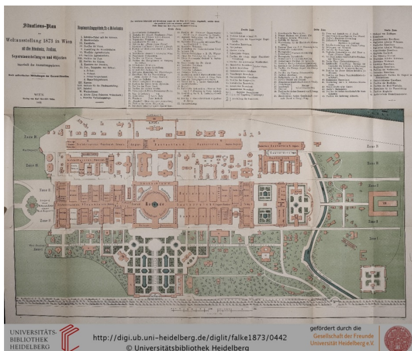
شکل (۱). نقشه‌ی کلی و پلان غرفه‌بندی نمایشگاه جهانی ۱۸۷۳ وین (Falke, 1873. p. 442)

به‌خوبی اهمیت و عظمت آن را نسبت به چهار دوره‌ی قبلی و شش دوره نمایشگاه بعدی - تا نمایشگاه ۱۸۸۹ میلادی پاریس که تعداد بازدیدکنندگان از ۱۶ میلیون نفر فراتر رفت - نشان می‌دهد (کهنسال نودهی و فولادی‌نسب، ۱۳۹۴، ۲۸).