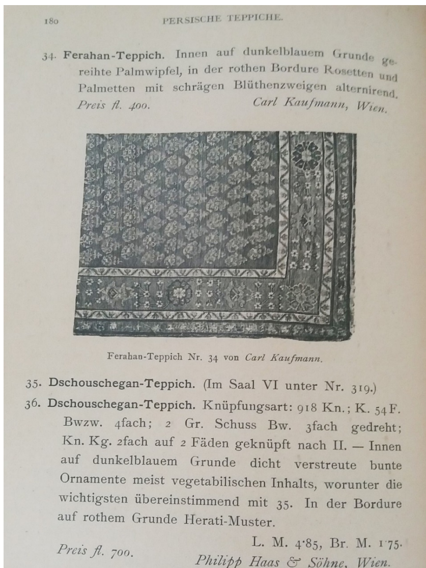
شکل (۶). برگی از دفترچه‌ی راهنمای نمایشگاه با معرفی و تصویر قالی فراهان

اطلاعات ثبت‌شده‌ی قالی‌ها نشان می‌دهد عمده‌ی این قالی‌ها با رایزنی‌های تجاری و دیپلماتیک موزه‌ی تجارت از سرتاسر جهان و توسط مجموعه‌داران خصوصی و برخی بنگاه‌های تجاری مستقر در اتریش از جمله شرکت معروف «فیلیپ هاس و پسران» ۱