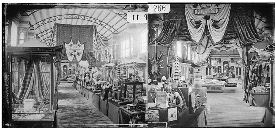
شکل (۲). دو نما از غرفه‌ی ایران در نمایشگاه ۱۸۷۳ وین (Fulco, 2017. p. 53)

قابلیت این را داشت که با سازوکارهای نمایی و روح حاکم بر فضا جزیی از نمایشگاه شود» (دل‌زنده، ۱۳۹۴، ۱۵۵). برپایی این نمایشگاه به امپراتوری اتریش کمک کرد تا روابط دیپلماتیک و اقتصادی گسترده‌ای را با کشورهای اسلامی شکل دهد و از طرفی این فرصت را برای کشورهای اسلامی از جمله ایران فراهم ساخت تا هنر، فرهنگ و معماری خود را به مردم اروپای مرکزی و اتریش معرفی کنند.