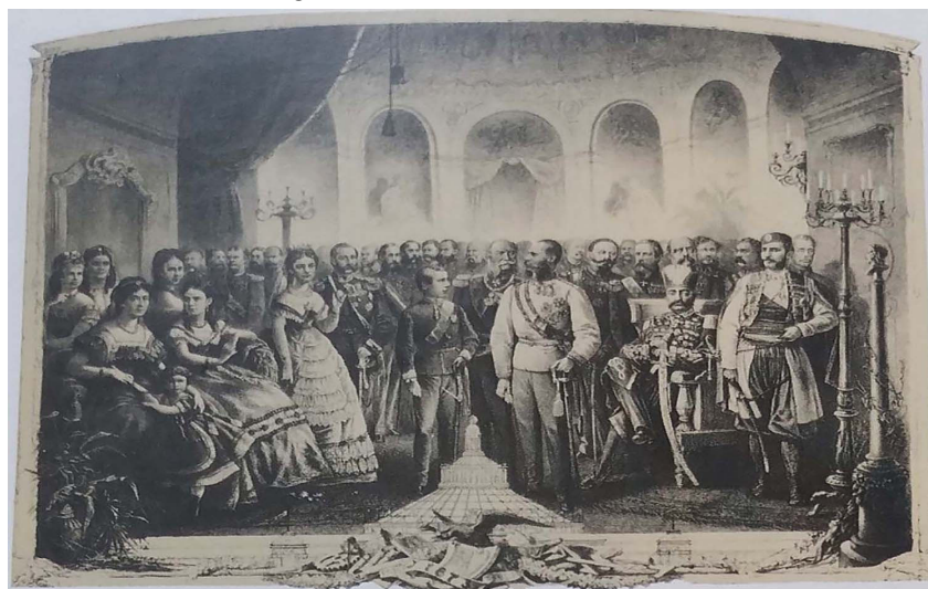
شکل (۳). ناصرالدین‌شاه نشسته بر تخت، در بین بازدیدکنندگان نمایشگاه جهانی ۱۸۷۳ وین