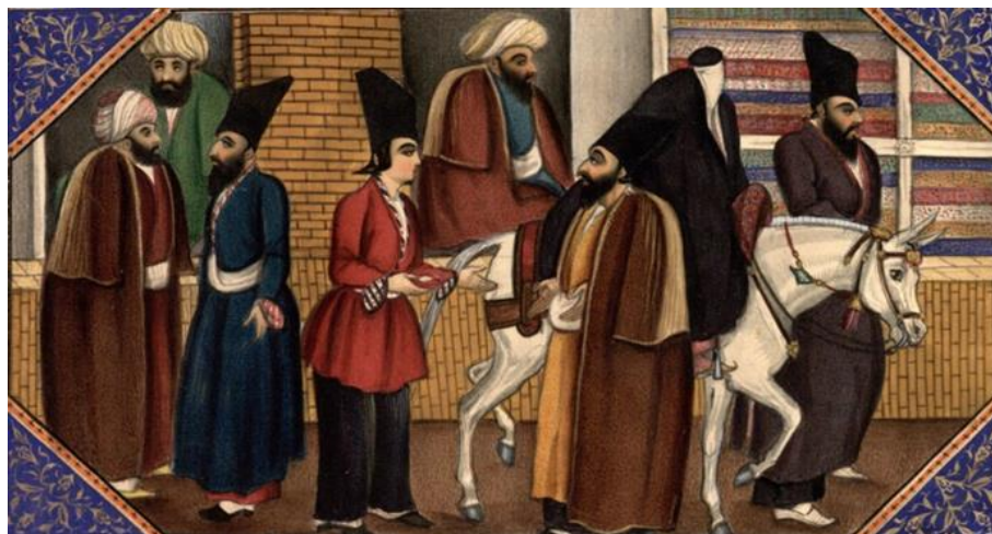
تصویر ۱: هزارویک شب صنیع‌الملک، سده ۱۳/ق/ ۱۹م، کاخ موزه گلستان (تهران) (نگارنده)