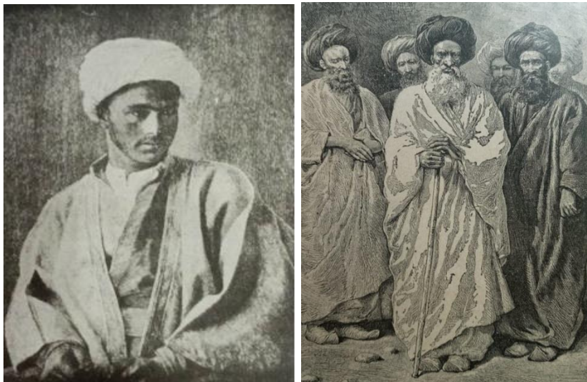
تصویر ۴: روحانیون قاجاری (دیولانوا، ۱۳۳۲: ۵۸) تصویر ۵: روحانی قاجاری (بنجامین، ۱۳۶۳: ۳۱۴)

به این ترتیب، قبا و عبا کم‌کم به عنوان کسوت روحانیت شیعه تعریف شد و صورت سمبلیک و استعاره‌ای پیدا کرد. این جنبه سمبلیک در جامعه معنی و مفهوم پیدا کرد به گونه‌ای که وقتی نوز ۱ بلژیکی در مراسم سال نو مسیحی، عبا و قبا و دیگر اجزای لباس روحانیت را به تن کرد، اهانت به روحانیت شیعه تلقی شد و اعتراض علما و مردم را برانگیخت (دولت آبادی، ۱۳۷۱: ۴/۲). برخی از نویسندگان از یادکرد این جریان از تعبیر «آخوند نوز» بهره گرفتند (مستوفی، ۱۳۸۴: ۶۳/۲) که این امر بیان‌کننده نمادین شدن تن‌پوش عبا و قبا برای روحانیت شیعه است.