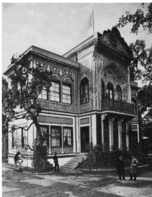
تصویر ۳. پاریون ایران در محوطه نمایشگاه ۱۸۷۳ وین، ماخذ: (Karl, 2014: 127).

اسلامی از جمله ایران فراهم کرد تا هنر، فرهنگ و معماری خود را به مردم اروپای مرکزی و اتریش معرفی کنند. در زمان برگزاری نمایشگاه جهانی، گروهی از تجار اتریشی به رهبری تاجری برجسته به نام آرتور فون اسکالا ۲ با تشکیل کمیته‌ای به نام «انجمن شرق سو برای تجارت و اقتصاد» ۳ تلاش‌های گسترده‌ای را برای ایجاد روابط گسترده تجاری با شرق و ارتقای جایگاه وین به مرکز تجارت شرق و غرب آغاز کردند. تلاش‌های این گروه در ادامه، به برپایی نخستین نمایشگاه جهانی فرش‌های شرقی در سال ۱۸۹۱ میلادی مصادف با آخرین سال حیات پولاک، منجر شد. دکتر پولاک در برپایی این نمایشگاه و شرکت دادن فرش‌های ایرانی در آن نقش مؤثری ایفا کرد (Stanzer, 1986: 41).