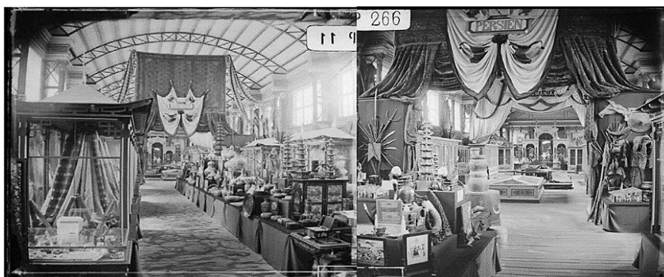
تصویر ۲. دو نما از غرفه ایران در نمایشگاه جهانی ۱۸۷۳ وین، ماخذ: (Fulco, 2015: 57).

دیوارهای متحرک و قفسه‌ها به نمایش گذاشته شد (Fulco, 2017: 55). (تصویر ۲).