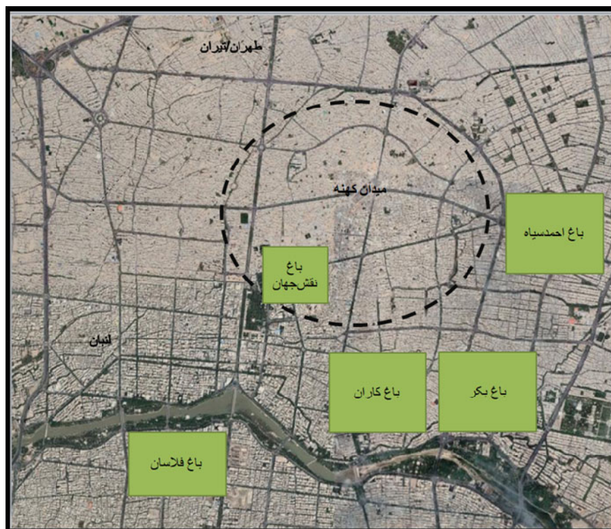
نقشه ۲: نقشه شهر اصفهان و باغ‌های سلطنتی آن در دوره سلجوقی بر روی نقشه اصفهان امروز (ماخذ: google earth با تغییرات نگارندگان)

نام یکی از بزرگان ۱ اصفهان که پسوند کوشکی داشته، حداقل تا قرن سوم هجری قابل پیگیری است. بر این اساس دوره ساخت این باغ به قبل از دوره سلجوقی می‌رسد.