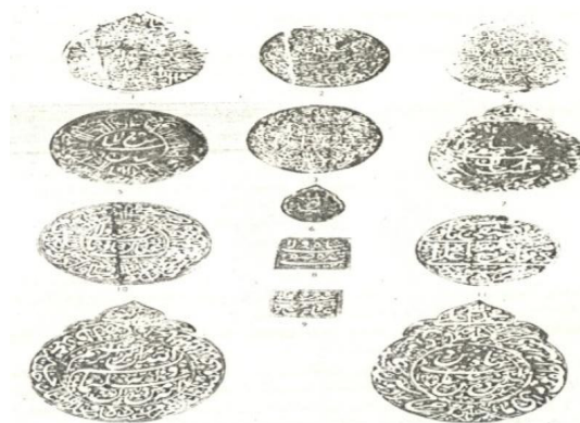
نقش مهر های پادشاهان صفوی

مُهر: رسم مهر کردن فرمان‌ها، از دیرباز در ایران معمول و شغل مهربرداری از مشاغل مورد احترام درباری بوده است، و سابقه‌ی آن به ایران باستان می‌رسد. ۱ پادشاهان عصر تمدن اسلامی در ایران نیز، همان‌گونه که مورخین و سیاحان بخصوص شاردن در آثار خود آورده‌اند؛ هر کدام دارای چندین مهر با اندازه، اشکال، جنس‌های متفاوت و هر کدام با توجه به ویژگی که داشتند در فرمانی خاص به کار می‌رفتند. به عنوان نمونه، کلیه‌ی امور دیوان ممالک از قبیل عهدنامه و مکاتبات با خارجیین و احکام اجازه‌نامه با مهری هلالی شکل از جنس فیروزه مهور می‌شد. اموری که مربوط به نظام بود و احکامی که از اداره‌ی خاصه صادر می‌گردید با مهر مربع شکل مهر می‌شد. مهر مربوط به امور مالی و خالصه و انتصابات دستگاه خاصه و امور سپاه با مهری از جنس یاقوت و مربع شکل مهور می‌شد. این مهر، از اقسام مهرهای دیگر مهم‌تر بود. مهر مدور شکل، بیشتر در امور موقوفات و انتصاب صدور تولیت مورد استفاده قرار می‌گرفت. ۲ در اعتبار بخشی به اسناد و نامه‌های رسمی نقش مهر مهم‌ترین رکن فرمان در طول تاریخ به شمار می‌آمده که با شکل‌های متنوع خود جلوه و نمای خاصی به فرمان‌ها می‌داده است. محل مهر، تا قبل از شاهان قراقویونلو و آق‌قویونلو در پایین مهر یا حواشی فرمان بوده، و از زمان تیموریان در سمت بالای فرمان جای گرفته است.