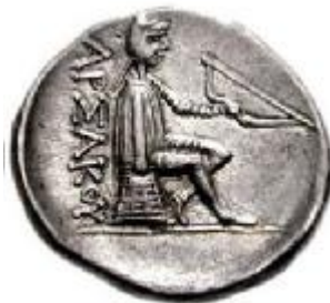
مهرداد اول، نوع ۷/۱ سلوود

دست بر پشت سکه‌ها، نقش بسته است؛ اما اینک اشک اول یا کماندار به جای اورنگ، نشسته بر اومفالوس ۱ مجسم شده؛ که طرحی برگرفته از سکه‌های سلوکی است.