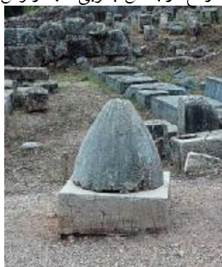
سنگ اومفالوس در گورستان دلفی