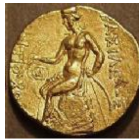
سکه‌های آنتیوخوس اول (۲۶۱-۲۸۱ پ.م)

بنا بر این، تصویر اشک اول یا کماندار نشسته بر اومفالوس در سکه‌های مهرداد اول، آن گاه که با پیشرفت‌های نظامی و سیاسی وی در رویاروی با سلوکیان مد نظر قرار می‌گیرد؛ ۶ از