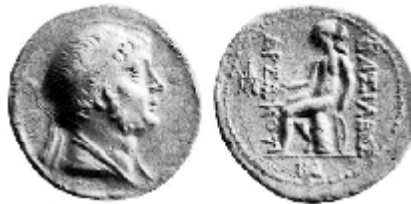
فرهاد دوم نوع ۱۴/۱ سلوود

اما در چهاردرهمی‌های نوع ۱۴ سلوود متعلق به فرهاد دوم، تصویر آپولو نشسته بر اومفالوس جایگزین تصویر ارشک کماندار می‌شود. این نقش به طرح سکه‌های سلوکی شباهت دارد. ضرب این سکه‌ها را می‌توان به دورانی نسبت داد که فرهاد دوم برای رویارویی با آنتیوخوس هفتم ۱ (۱۲۹ پ.م - ۱۳۸ پ.م)، درصدد جلب حمایت مهاجرنشین‌های یونانی ایالت ماد بود. ۲