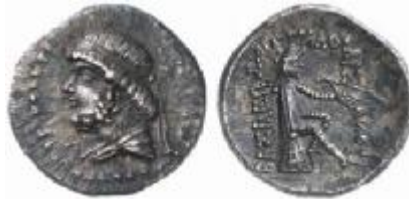
نوع ۱۵/۲ سلوود

در درهم های فرهاد دوم نیز نقش اشک اول جایگزین آپولو می شود که در واقع بازگشتی به طرح آغازین پشت سکه های اشکانی است، اما اشک در جهت مخالف تصویر آپولو و همانند سکه های مهرداد اول طراحی شده است.