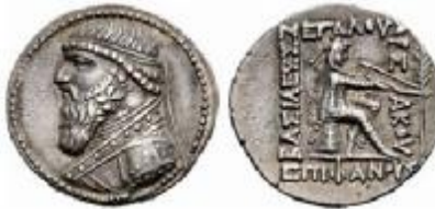
مهرداد دوم، نوع ۲۴ سلوود

در سکه مهرداد دوم، نوع ۲۴ سلوود، طرح شاخه نخل به نقش کماندار نشسته بر اومفالوس افزوده شده است که کمابیش طرح سکه نوع ۱۸/۲ سلوود را تداعی می کند؛ با این تفاوت که کماندار جایگزین آپولو شده است. چنین سکه هایی در سلوکیه ضرب شده اند.