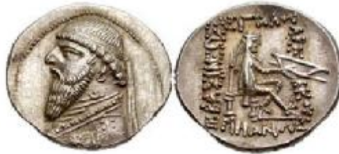
مهرداد دوم، نوع ۲۶ سلوود

نکته شایان توجه این است که در سکه‌های مهرداد دوم، نوع ۲۶ که تصویر سالخورده او را به نمایش می‌گذارند، تصویر اومفالوس از سکه‌ها حذف و نقش اورنگ یا تخت سلطنت، مشابه طرح سکه‌های آغازین ارشک اول، جایگزین آن می‌شود. در این سکه، مهرداد دوم علاوه بر کمان یک تیر هم در دست دارد.