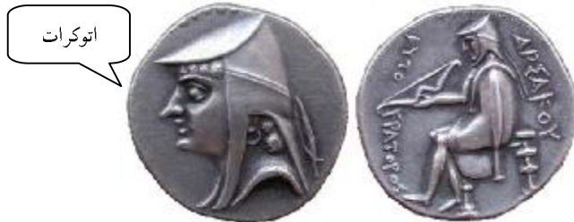
اشک اول، نوع ۲/۱ سلوود ضرب احتمالی نیسا

نقش کماندار بر پشت درهم‌های دوره اشکانی به جز دوران ونن اول (۸-۱۲ م.)، به سمت راست است. نمای کلی این طرح به سکه تارکامووا ۱ شهرت / ساتراپ هخامنشیان در تارسوس ۲ و کاپادوکیه، ۳ شباهت دارد که در قرن چهارم پ.م ضرب شده است. ۴ طرح کلاه، شال روی شانه و طرح اورنگ و کمان کاملاً یکسان است؛ بنابراین برخی محققان این شباهت را تصادفی نمی‌دانند و معتقدند طرح سکه‌های ارشک احتمالاً اقتباسی از سکه‌های تارکامووا است. ۵