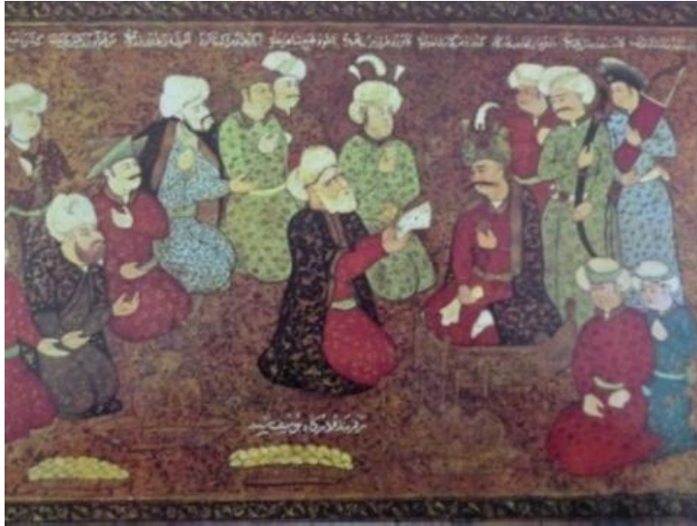
تصویر ۲- شرفیابی نماینده آلمان به حضور شاه عباس (در ب صندوقچه) ۱

روابط فرهنگی ایران و آلمان از عصر صفوی تا پایان دوره قاجار ۱۲۷