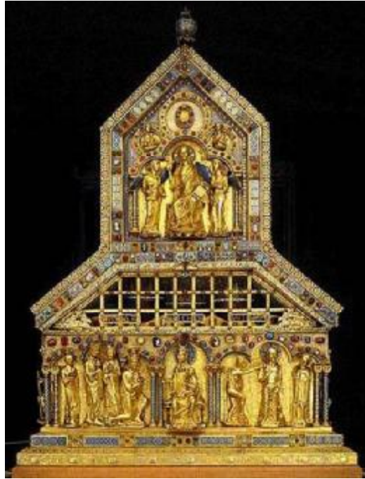
تصویر ۱- آرامگاه سه سه مغ'

۱. تاریخ بازدید: ۰۷/۰۹/۱۳۹۰ www.koelner-dom.de/index.php?id=1771890