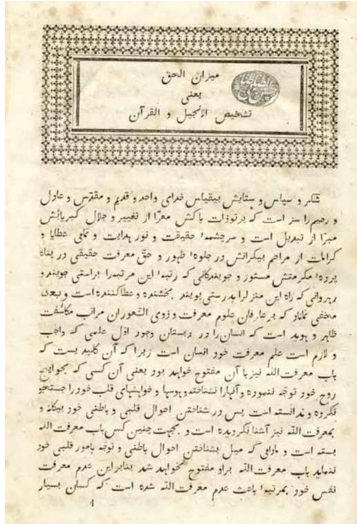
تصویر ۵۵ صفحه ۱ از کتاب میزان الحق، چاپ سنگی ۱