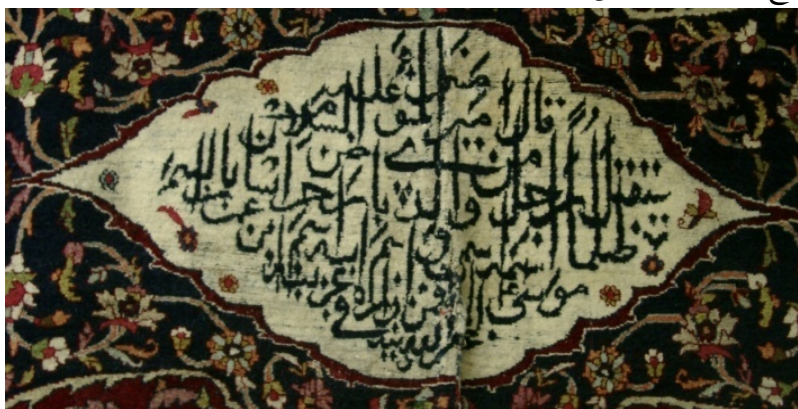
تصویر ۳. کتیبه داخل ترنج پیشانی قالی پرده‌ای دو رو.

۱. پیشانی: این قسمت با حرکت زنجیره چهارم به داخل متن فرش از طاق محراب جدا شده و طراح در فضای مستطیل ایجاد شده طرح لچک و ترنج را اجرا کرده است. لچک‌های این قالیچه به رنگ لاک‌ی و مزین به عناصر ختایی هستند. متن قالیچه سورمه‌ای و با گردش شاخه ختایی تزیین شده است. ترنج آن به رنگ کرم و لوزی شکل است و در آن حدیثی به رنگ تیره و به قلم ثلث آمده است: (تصویر ۳) قال امیرالمؤمنین علیه السلام سیقتل رجل من ولدی بارض خراسان بالسم ظلماً اسمه اسمی و اسم ابیه اسم ابن عمران موسی (ع) الا فمن زاره فی غربه غفر الله ذنبه ۱