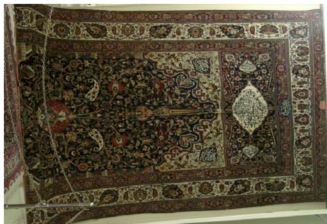
تصویر ۱. نمای کلی قالی پرده‌ای دو رو با نقش محرابی - افشان شاه‌عباسی قنديل‌دار.

قالی «محرابی - افشان شاه‌عباسی قنديل‌دار» به شماره شناسایی ۰۴۱ ردیف ۴۰ و شماره اموالی ۳۴۷ در معرض دید عموم مردم قرار دارد. (تصویر ۱) این دستباف با توجه به کتیبه‌های موجود در ۱۳۲۲ ق. / ۱۹۰۴ م. در شهر مشهد و با همکاری تولیدکنندگان تبریزی، مشهدی و کرمانی در ابعاد ۳۲۱ × ۴۱۰ سانتیمتر بافته شده است. جنس تار و پود آن پنبه و پرز از پشم است. در هر ۶/۵ سانتیمتر ۴۰ گره نامتقارن (فارسی) زده شده، طول ساق‌های گره بین ۳/۵ الی ۵ میلی‌متر است. فرش به شیوه تمام لول بافته شده است و پس از هر رج بافت پود ضخیم و نازک را عبور داده‌اند، شیرازه نیز در وسط و طرفین قالی به صورت متصل بافته شده است. رنگ‌های آن شیمیایی و گیاهی هستند عمده رنگ‌های قالی عبارت‌اند از: لاک‌ی قرمز دانه، سورمه‌ای، آبی، نارنجی، کرم، سبز روشن، آبی تیره، قهوه‌ای روشن، سبز زیتونی، سبز آبی روشن، آبی روشن، بنفش روشن، خاکستری، روناسی و... قسمت‌هایی از فرش دچار صدماتی از قبیل بیدزدگی، ساییدگی، پارگی و دورنگی است که نیاز به مرمت مجدد دارد.