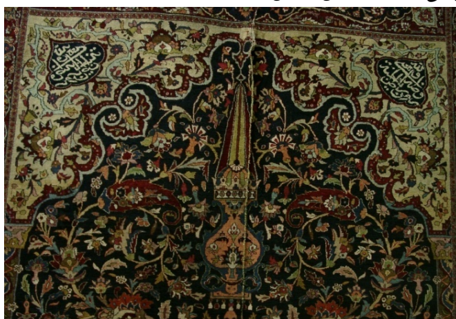
تصویر ۴. طاق محراب همراه با کتیبه‌ها و قندیل.

ج) متن قالی: متن قالی به رنگ سورمه‌ای بافته شده است. طراح با ایجاد دونیم ستون و قرار دادن طاق محراب بر روی آن فضای همچون مدخل ورودی باغ ایرانی یا محراب مساجد ایجاد کرده است. متن اصلی با طرح افشان شاه‌عباسی تزیین شده است. طراح بند ختایی را از دو سمت گل شاه‌عباسی بزرگی که در قسمت پایین قرار گرفته، خارج کرده و در تمامی متن قالی به حرکت درآورده است. این قسمت، همچون حاشیه‌ی اصلی شباهت فراوانی به آثار شاخص عصر صفوی به ویژه فرش افشان شاه‌عباسی گلابتون‌دار موزه‌ی