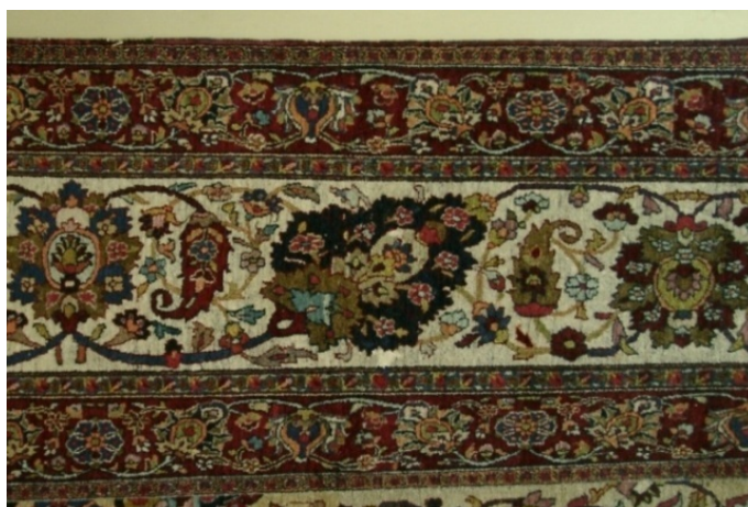
تصویر ۲. حاشیه اصلی و دو حاشیه فرعی با طرح هراتی تزیین شده است. (مأخذ تصویر: نگارنده).

الف) حاشیه: حاشیه‌ی فرش، دارای هشت نوار تزیینی است. (تصویر ۲) لور یا ساده‌بافی بدون طرح و به رنگ قرمز لاک‌پشته شده است. زنجیره اول به رنگ نارنجی و با عناصر کوچک ختایی تزیین شده است. لازم به ذکر است که فقط همین دو قسمت (زنجیره و ساده‌بافی) دورتادور فرش بافته شده‌اند و سایر نوارهای تزیینی تنها در سه سمت (بالا و سمت چپ و راست قالی) به حرکت درآمده‌اند. حاشیه‌ی فرعی اول و دوم به رنگ لاک‌پشته با گل و برگ ختایی تزیین شده است. زنجیره‌های دوم و سوم به رنگ آبی تیره و به شیوه‌ی واگیره محو کار شده است.