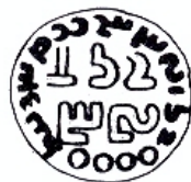
شکل ۹. استاندار ویروزان ۵

نام ویروزان توسط یک مهر استاندار شناخته می‌شود (شکل ۹). پیش از این با اردان روی یک مهر آمارگر (شکل ۴) و نیز با اردان، ارمین، سیسگان و مرز نیسوان روی یک مهر زربد (شکل ۳) مشاهده شد.