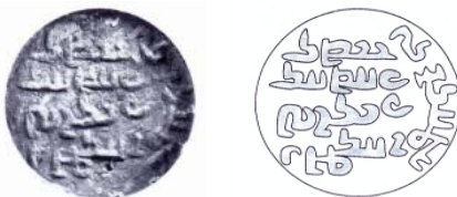
شکل ۶. گِل مُهر آمارگر آرمین و شهر پادار پیروز ۴