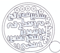
شکل ۷. گل مُهر آمارگر ایران-ابزود-خسرو، نسین، اروایستان و ارزون ۲

این نام بر روی یک مُهر استاندار (شکل ۸) همچنین بر روی یک مُهر آمارگر (شکل ۷) به همراه نسین، اروایستان و ارزون مشاهده می‌شود.