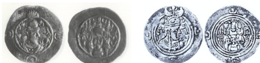
شکل ۲. سکه‌های پوراندخت ۲ و هرمزد چهارم ضرب ویروزان ۳

این مونوگرام را گوبل ۱ نامشخص و به احتمال در شمال یا شرق امپراتوری می‌داند. با توجه به سنگ‌نبشته شاپور یکم در کعبه زردشت می‌توان این نام را مورد بررسی قرار داد. در متن پهلوی به شکل wlc'w'n، در متن پارتی wyršn، و در متن یونانی Iberias خوانده می‌شود. با توجه به متن پهلوی می‌توان آن را وروچان خواند که در واقع نام ساسانی گرجستان شرقی است. این نام در پایان دوره ساسانی بر روی گِل‌مُهرهای این دوره ویروزان نوشته شده است. نام این سکه‌خانه در سکه‌های خسرو یکم، هرمزد چهارم (۵۷۹-۵۹۰ م.)، اردشیر سوم و پوراندخت (۶۳۰ م.) دیده شده است (شکل ۲).