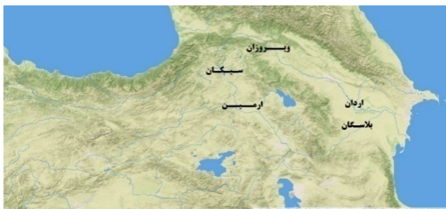
نقشه ۲. قلمرو ساسانیان بر اساس سنگ‌نبشته‌های سده سوم م.