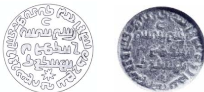
شکل ۵. گِل مُهر آمارگر آرمین و بازاها و شهر موگان و کوست آذربادگان ۳

این نام جای بر روی یک مُهر آمارگر (شکل ۶) همراه با شهر پادار پیروز، روی مُهر دیگری از آمارگر (شکل ۵) همراه با نام بازاها، شهر موگان و کوست آذربادگان، و همچنین با اردان، ویروزان، سیسگان و مرز نیسوان بر روی مُهری از زربد آمده است (شکل ۳).