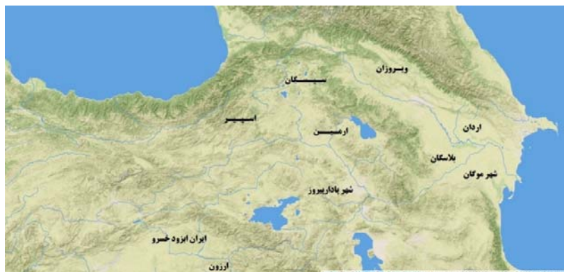
نقشه ۳. نواحی ساسانی در قفقاز جنوبی بر اساس مدارک مهرنگاری