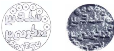
شکل ۳. گل‌مُهر زَرید با نام‌های ارمین، آردان، ویروزان، سیسگان و مرز نیسوان ۹

نام آردان همراه با نام ویروزان روی یک مُهر آمارگر (شکل ۴) و همچنین با ویروزان، ارمین، سیسگان و مرز نیسوان روی یک مُهر زَرید (شکل ۳) قرار دارد. ۸ نام ارمین را بر روی مُهرهای زربد و آمارگر، همراه با شهر پادار پیروز، بازاها، شهر موگان و کوست آذربادگان مشاهده می‌شود.