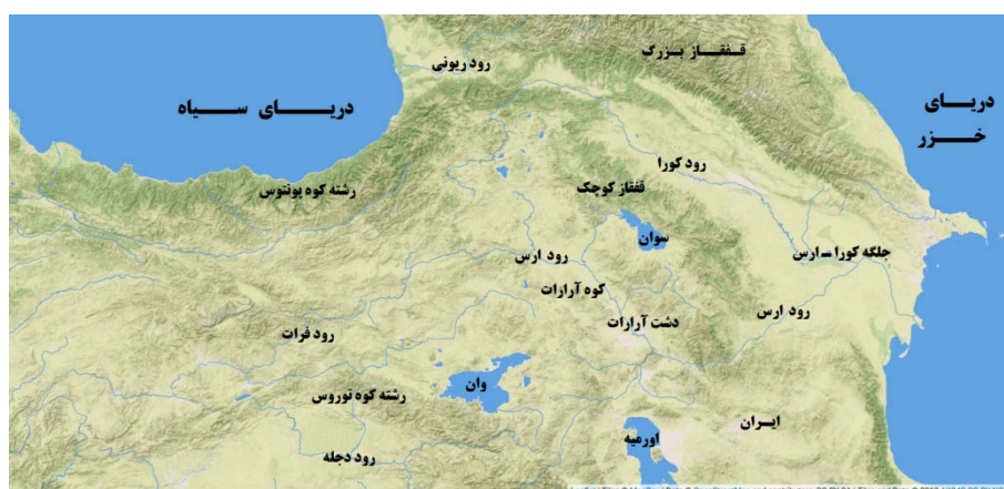
نقشه ۱. وضع ناهمواری‌ها و رودهای قفقاز جنوبی

بنابراین، همان‌طور که مشاهده می‌شود، قفقاز جنوبی سرزمینی بسیار کوهستانی است که با مرزهای کوهستانی خود از سایر مناطق جدا شده و شامل کشورهای آذربایجان، گرجستان، ارمنستان و شرق ترکیه امروزی است.