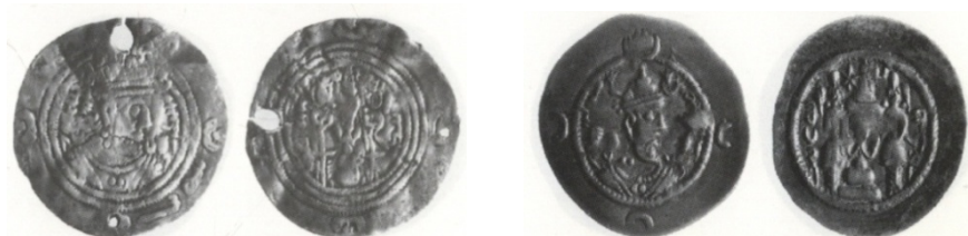
شکل ۱. سکه‌های خسرو یکم و خسرو دوم ضرب ارمین ۳

نام ارمینستان به صورت کوتاه‌شده‌ی ARM بر سکه‌های ساسانی دیده می‌شود. گوبل ۱ معتقد است که این نام هنوز قابل جایابی نیست و نظر هرتسفلد در مورد ارمینه را نیز به دلیل این که بدون توضیح خاصی ارائه شده نمی‌پذیرد. پاروک نخستین کسی بود که مونوگرام ARM را برای ارمینستان پیشنهاد کرد. ۲ این نام در سکه‌های بهرام پنجم (۴۲۰-۴۳۸ م.)، یزدگرد دوم (۴۳۸-۴۵۷ م.)، پیروز (۴۵۹-۴۸۴ م.)، بلاش (۴۸۴-۴۸۸ م.)، قباد یکم (۴۸۸-۴۹۶ م؛ ۴۹۹-۵۳۱ م.)، زاماسب، قباد دوم (۶۲۸-۶۳۰ م.)، خسرو یکم (۵۳۱-۵۷۹ م.)، هرمزد چهارم (۵۷۹-۵۹۰ م.)، خسرو دوم (۵۹۱-۶۲۸ م.)، اردشیر سوم (۶۳۰ م.) و یزدگرد سوم (۶۳۲-۶۵۱ م.) دیده شده است (شکل ۱).