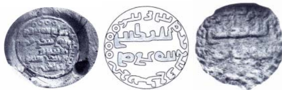
شکل ۸. استاندار ایران-ابزود - خسرو ۳