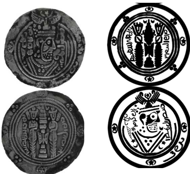
تصویر ۲. طرح و تصویر سکه دات برزمهر، موزه بانک سپه، ۱۱۲۵۵