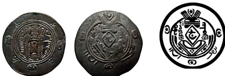
تصویر ۹. طرح و سکه سلیمان (موزه پول بنیاد، ۴۳۲۱۱-م)

در میان سکه‌های ولات عباسی سکه‌های سلیمان (حک. ۱۳۶-۱۳۸ پی. ۷۸۸-۷۹۰ م.) شکل متمایزی دارد و به جای چهره پادشاه، لوزی با سورشارژ بیخ خ به کوفی آمده است (تصویر ۹). این شکل سکه شاید تغییری بوده که سلیمان ضروری می‌دانسته تا بدین وسیله وجدان دینی خود را به عنوان یک مسلمان راضی نگه دارد، ۱ تغییری که احتمالاً به دلیل تمایل به مبارزه با بت‌پرستی بوده و بر اساس آن به‌کارگیری عکس را منع کرده است. ۲ سکه سلیمان گرچه چهره پادشاه را مخدوش کرده، ولی نمادهای مرتبط با زرتشت چون بال‌های گشوده، هلال ماه و ستاره، خط پهلوی و کتیبه‌های مذهبی، گردنبند و گوشواره، آتشدان و نگهبانان برسم به دست و سه نقطه نمادین را بر خود دارد.