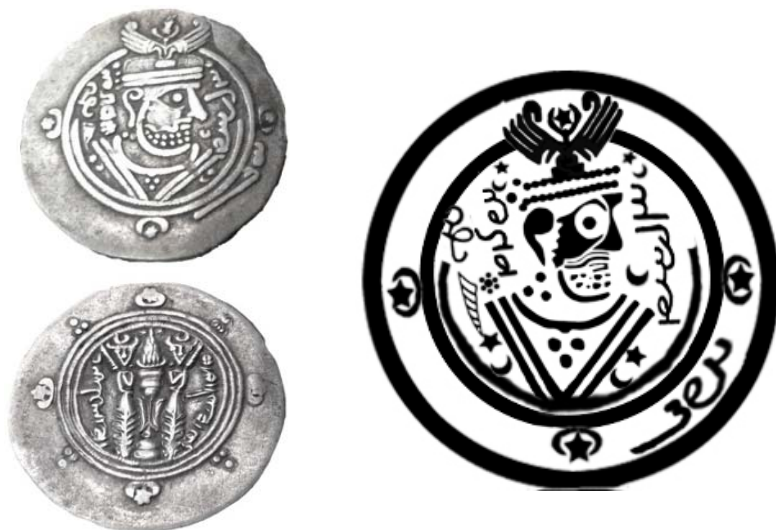
تصویر ۳. طرح و تصویر سکه خورشید، موزه بابل، ۶۴۲