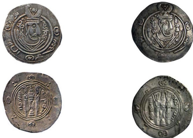
۱. سکه بی‌نام، آستان قدس، س ۴۴۲۹ ۲. سکه بی‌نام، موزه پول بنیاد، ۴۹۳۴۷-م