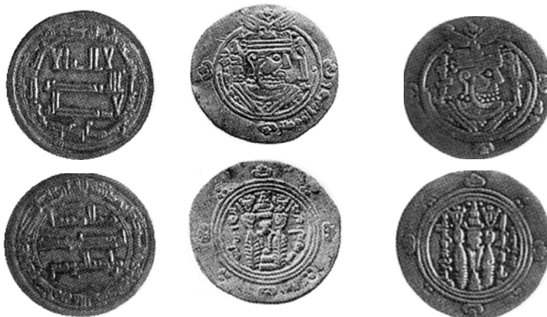
۱. بانک سپه، ۱۵۸۴. ۲. Malek, 2004: 17, 54.3. ۳. Malek, 2004: 17, 54b.1.