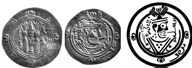
تصویر ۵. طرح و سکه خالد بن برمک، بانک سپه، ۱۶۱۲