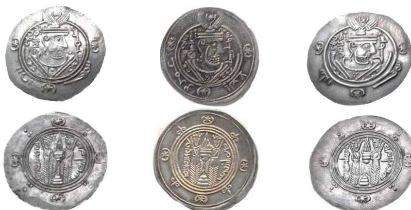
۱. موزه ملک، ۲۰۸۸ ۲. موزه پول بنیاد، ۳۴۹۶۹-م ۳. آستان قدس، ۷۶۰۲ ر ۲