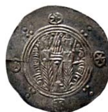
۳. معد، بانک سپه، ۱۰۶۷۷. ۴. مقاتل، آستان قدس، س ۴۲۲۹. ۵. قُدید، Malek, 2004: 124, 137.2.