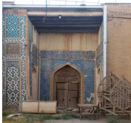
تصویر شماره ۱: سردر دارالسیاده (راست)، جانمایی کتیبه بر سردر دارالسیاده (چپ)