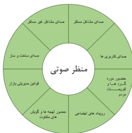
(شکل-۲): مدل مفهومی عوامل مؤثر در بازار تاریخی تبریز

با مطالعه مؤلفه‌های مطرح‌شده در کتاب شفر و بازخوانی این مؤلفه‌ها در فرهنگ زندگی شهری در ایران، مؤلفه‌های زیر قابل بررسی هستند: