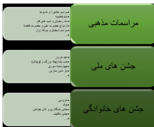
(شکل-۷): دسته‌بندی آداب اجتماعی بر اساس بررسی‌های میدانی

مراسم‌های ایرانیان بنا بر آداب و رسوم نیازهایی دارند که باعث تکاپو و خرید در بازار می‌شد؛ مثلاً مراسم خنچه‌بردن که در شب یلدا، عید نوروز، عید قربان و غدیر با قراردادن هدایا در طبق‌های چوبی و تزیین آن برای تقدیم به او عروس و داماد خانواده آن‌ها موجب حضور خانواده‌ها برای خرید در بازار می‌شد.